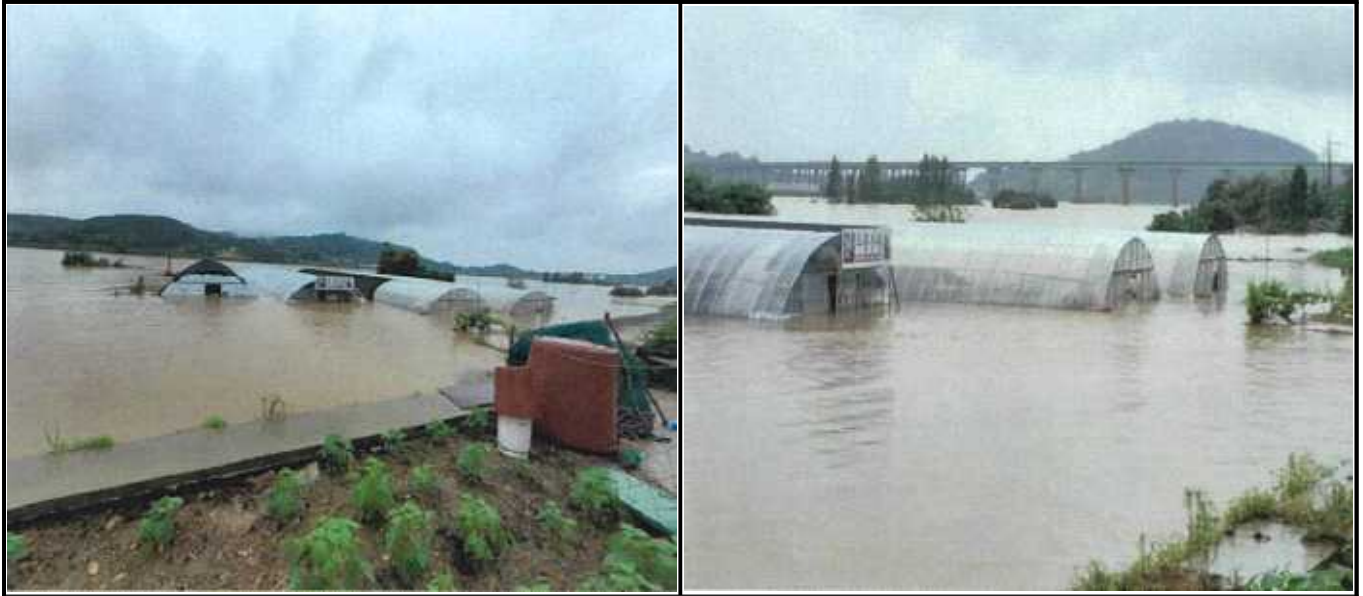
대흥면 손지리 783-2(두릅농원)