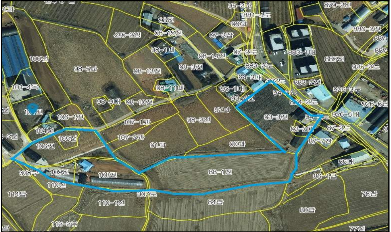
내포 농생명 융·복합 산업 클러스터 연구단지 편입 토지