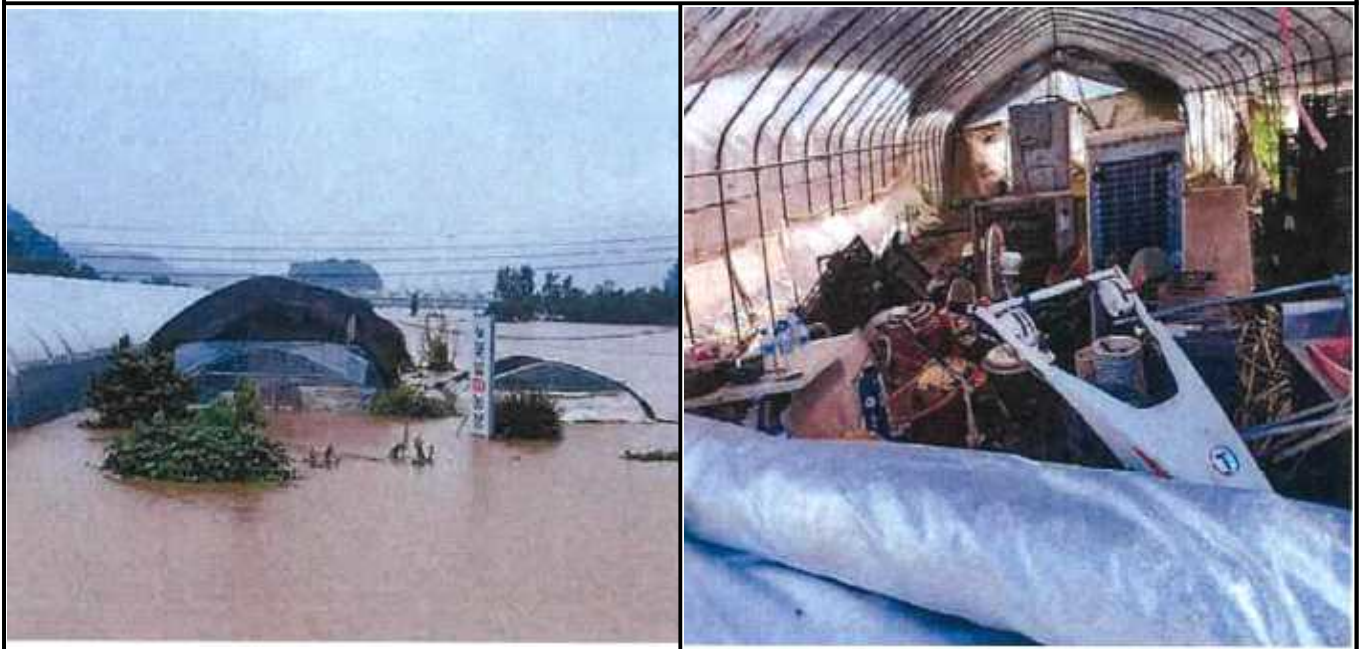
대흥면 손지리 133-1(꽃말)